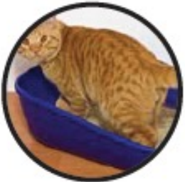
Olores de Mascotas