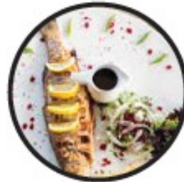
Olores a Comida

* Incluido MS2 (un sustituto de prueba ampliamente aceptado para SARS-CoV-2; el virus que causa Covid-19)